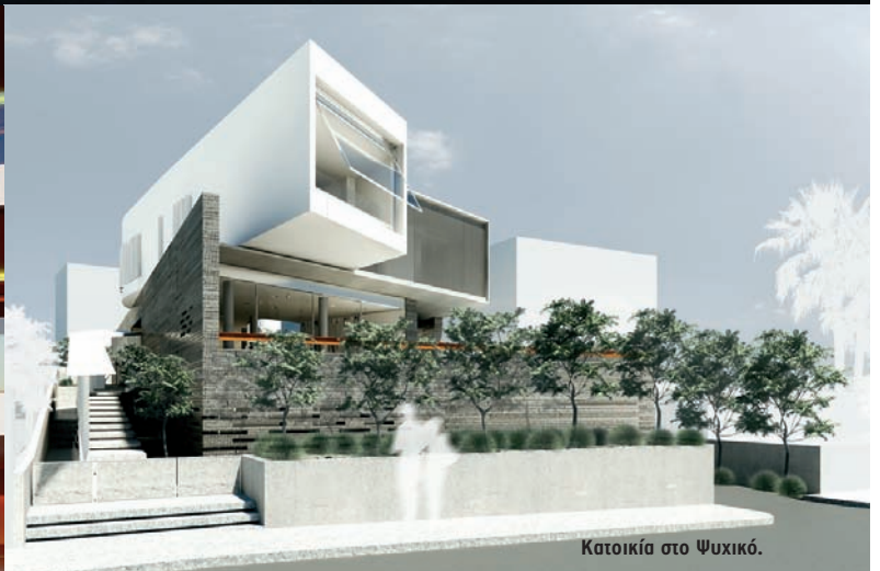
Κατοικία στο Ψυχικό.