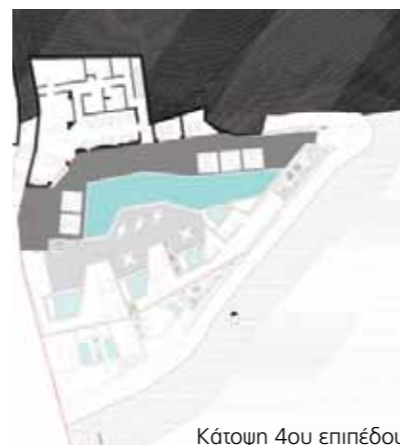
Κάτοψη 4ου επιπέδου

Πώς θα μπορούσε κανείς να ανανεώσει την παραδοσιακή αρχιτεκτονική σε ένα μοναδικό τοπίο στη Σαντορίνη, με θέα την καλντέρα, απέναντι από το βράχο του Σκάρου; Γιατί στο Ημεροβίγλι της Σαντορίνης τα ενοικιαζόμενα δωμάτια τυπικά μεταμφιέζονται σε ρουστίκ κουκλόσπιτα με μια κλωνοποίηση από θόλους. Σε αντιδιαστολή, η διάταξη των δωματίων του νέου ξενοδοχείου Santorini Grace ακολουθεί σε κάτοψη την τεθλασμένη γεωμετρία των υψομετρικών